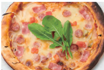
混合比萨 ミックスピザ ¥1,450