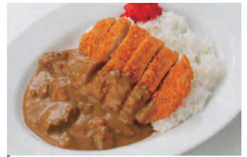
炸猪排咖喱 カツカレー ¥1,100