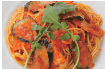
茄子培根的 茄子とベーコンの 西红柿奶油意大利面 ¥1,050