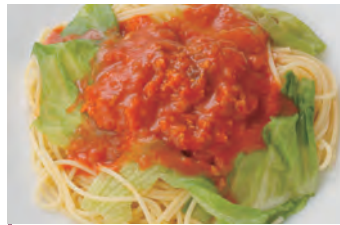
辣肉酱 辛口ミートソース 意大利面 ¥1,050