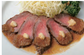
闷烤牛肉 ローストビーフ ¥1,150