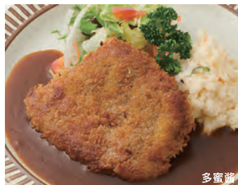
炸牛排 多蜜酱 ビーフカツレット ¥1,870