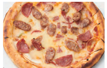
西班牙辣香肠 チョリソサラミ 比萨 ¥1,800