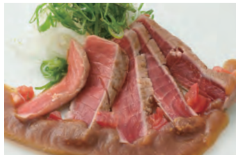
特制酱油 あぶりマグロ特製醤油だれ 炙烤金枪鱼 ¥1,400