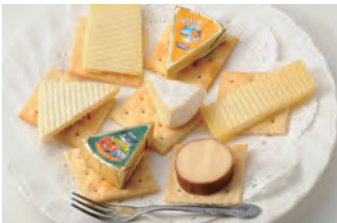
多种芝士拼盘 チーズ色々盛合せ ¥1,320