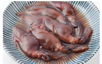
腌莹鱿 ほたるいかの沖漬け ¥660