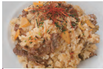
蒜香牛肉饭 ガーリック ¥1,100