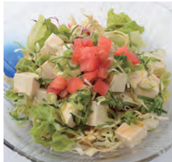
豆腐和蔬菜沙拉 豆腐と野菜のサラダ ¥880