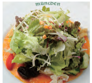
蔬菜沙拉 野菜サラダ ¥1,050