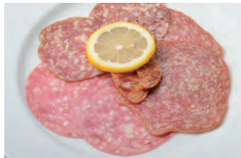
意式腊香肠 サラミの盛合せ 拼盘 ¥1,150