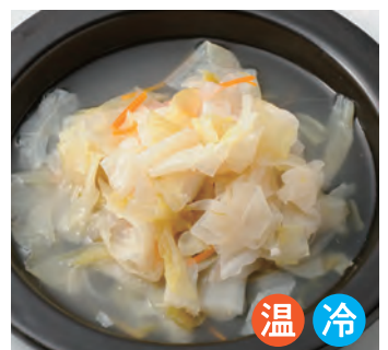
德国酸菜 ザワークラウト[温・冷] ¥680