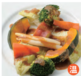
多种蒸蔬菜 色々温野菜 ¥1,000