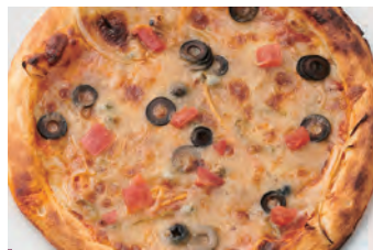
凤尾鱼 アンチョビシシリアーノピザ 西西里亚风比萨 ¥1,600