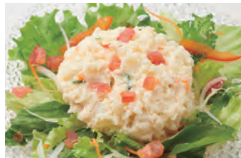
土豆沙拉 ポテトサラダ ¥750