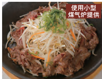
酱烧蔬菜与和牛 使用小型煤气炉提供 野菜と和牛のうまダシ焼き ¥1,320