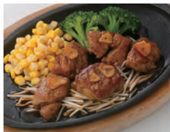
骰子牛排 Stamina サイコロステーキ ¥1,650