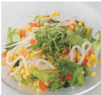
乌冬沙拉 (青紫苏味) うどんサラダ(青しそ風味) ¥880