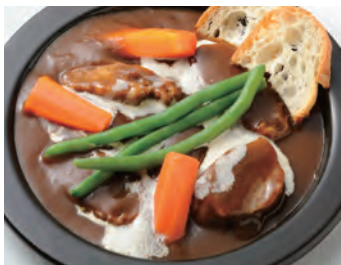
和牛炖菜 (附沙拉) 和牛ビーフシチュー ¥1,800