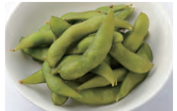
毛豆 枝豆 ¥440