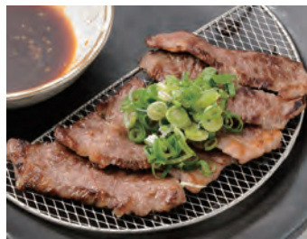
炙烤和牛切片 (和牛牛五花) 和牛焼しゃぶ (和牛カルビ) ¥1,600