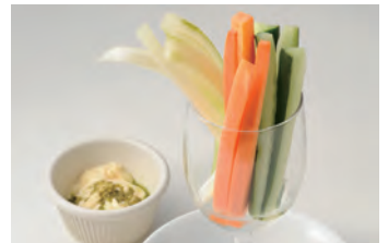
蔬菜棒 スティック野菜 ¥650