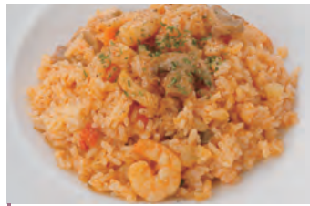
海鲜炒饭 シーフードピラフ ¥950