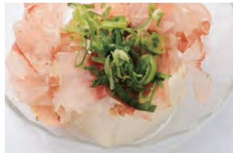
凉拌豆腐 冷奴 ¥500