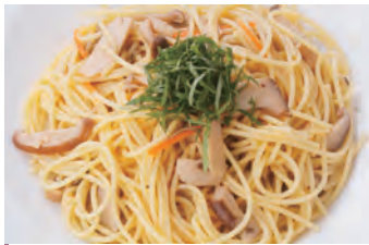
和风蘑菇 和風きのこスパゲティ 意大利面 ¥1,050