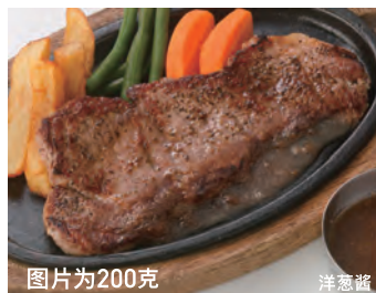
沙朗牛排 100g¥1,870/200g¥3,080 图片为200克 サーロインステーキ 洋葱酱