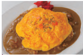
煎鸡蛋卷咖喱饭 オムレツ 咖喱饭上盖有松软的鸡蛋 カレーライスにふわふわ卵をのせて ¥1,000