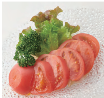
切片西红柿沙拉 冷しトマトのサラダ ¥750