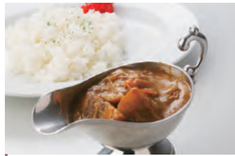
块状和牛 和牛ゴロっと 牛肉咖喱 ビーフカレー ¥1,650