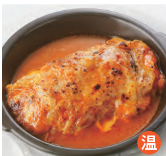
巨型卷心菜卷 ジャンボロールキャベツ ¥1,500