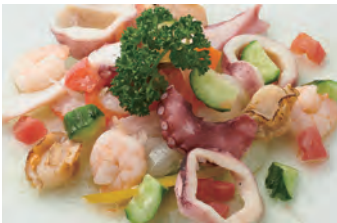
凉拌海鲜 シーフードのマリネ 虾・乌贼・章鱼・扇贝 ¥1,300