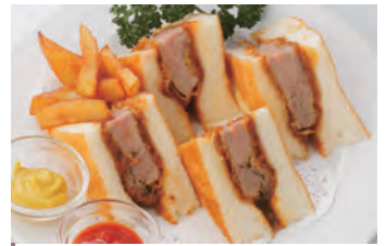
炸牛肉三明治 ピフカツサンド ¥1,980