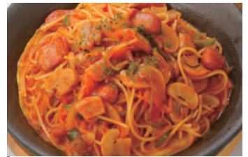
铁板那不勒斯风 鉄板ナポリタン 意大利面 ¥1,100