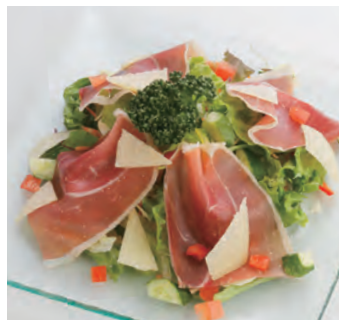
生火腿与帕马森干酪沙拉 生ハムとパルメジャーノのサラダ ¥1,210