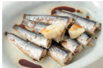
油渍沙丁鱼 オイルサーディン ¥850