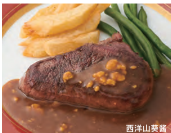
国产菲力牛排 150克 西洋山葵酱 国産牛ひれステーキ ¥4,400