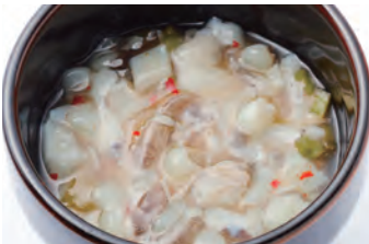
芥末章鱼 タコのわさび漬け ¥660