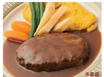
汉堡肉排 附有鸡蛋 多蜜酱 ハンバーグステーキ 玉子添え ¥1,400