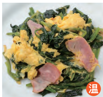
炒菠菜 ほうれん草のソテー ¥950