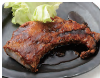
豪华排骨 (带骨肋排) [日本产猪] リブ・デラックス (スペアリブ) [国産豚] ¥1,870