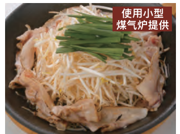
猪五花和豆芽的肉酱烧 使用小型煤气炉提供 豚バラもやしのフルコギソース ¥960