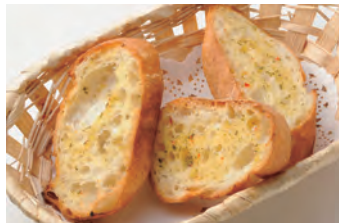
蒜香烤面包 ガーリックトースト ¥480