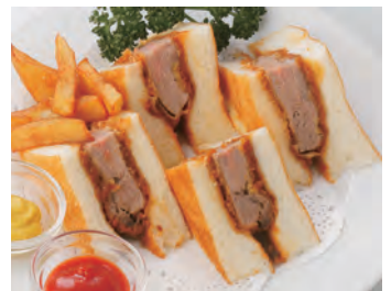
炸牛肉三明治 ビフカツサンド ¥1,980