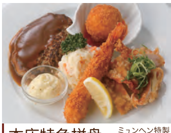
本店特色拼盘 ミュンヘン特製 盛合せ料理 ¥1,760 香味酱汁炸鸡块·炸虾·蟹肉奶油可乐饼·牛肉饼 若鶏の唐揚げソース・海老フライ・かにクリームコロッケ・ハンバーグ