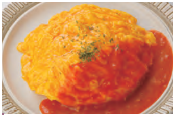
蛋包饭 オムライス ¥1,100