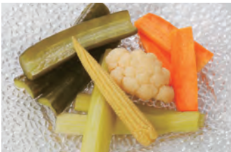
多种蔬菜 色々野菜の 自家制腌菜 自家製ピクルス ¥770