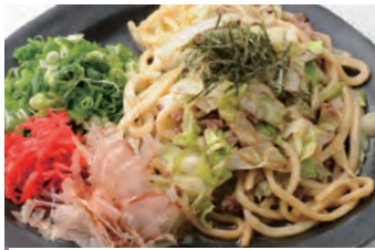
葱炒乌冬面 ねぎたっぷり焼うどん (使用和牛) ¥1,100