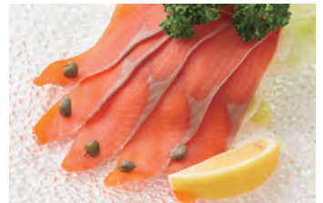
烟熏三文鱼 スモークサーモン ¥1,200