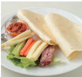
特制墨西哥卷饼 特製タコス ¥940