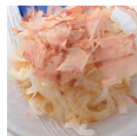
洋葱薄片 オニオンスライス ¥600