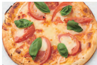
玛格丽特比萨 マルゲリータピザ ¥1,750