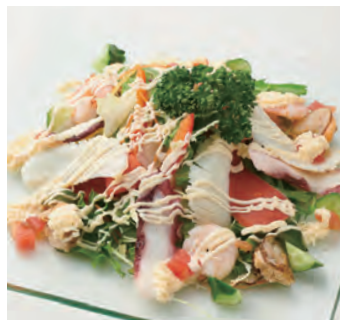
海鲜沙拉 シーフードサラダ ¥1,600