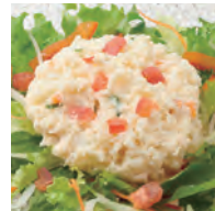
土豆沙拉 ポテトサラダ ¥750