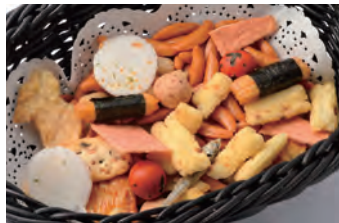
仙贝花生 あられの盛合せ ¥580